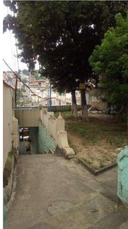
Figure 9. La Zone des arbres

Au fil des travaux, l'équipe du projet a même songé à demander l'intervention des services de protection du patrimoine historique. Les recherches ont démontré que le manoir n'était pas classé, mais comme il s'agit d'une construction du XIXe siècle, toutes modifications internes ou externes doivent théoriquement être autorisées par la municipalité. Après de nombreuses discussions au sein de l'équipe, nous avons jugé qu'il n'était pas souhaitable de solliciter les services de protection du patrimoine, car ils pourraient mettre en question l'occupation du manoir, mettant en péril le logement des résidents. Comme le projet ne dispose pas de ressources pour les travaux, cette question importante devra être remise à un projet d'assistance technique futur, susceptible de concilier l'amélioration du logement avec la protection du patrimoine.