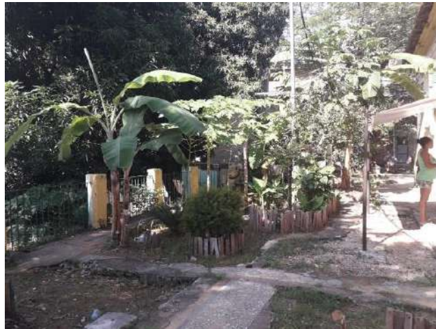
Figures 1 et 2. Manoir du Barão de Chichorro en 2019

Cet ensemble de logements est situé dans le quartier de Catumbi, au pied d'une colline et de la favela da Mineira. La propriété se composait de la maison principale entourée d'un vaste terrain. Le sous-sol du manoir était destiné à la « senzala » (espace réservé aux esclaves). Les habitants actuels nous ont rapporté qu'ils avaient trouvé un grand nombre d'objets liés à l'esclavage, ainsi que des ossements, lors de travaux effectués dans le manoir. La propriété était immense et a graduellement été lotie et vendue. Les habitants rapportent qu'à la fin du XIX e siècle et au début du XX e siècle, la zone a servi à héberger des malades de la tuberculose, jusqu'à ce qu'elle soit acquise par un commerçant espagnol du quartier, Rafael Garcia. Ce dernier a pris possession du terrain et a loué la maison à plusieurs familles. Sa veuve, Dona Cacilda Garcia, a continué à exploiter le site après sa mort.