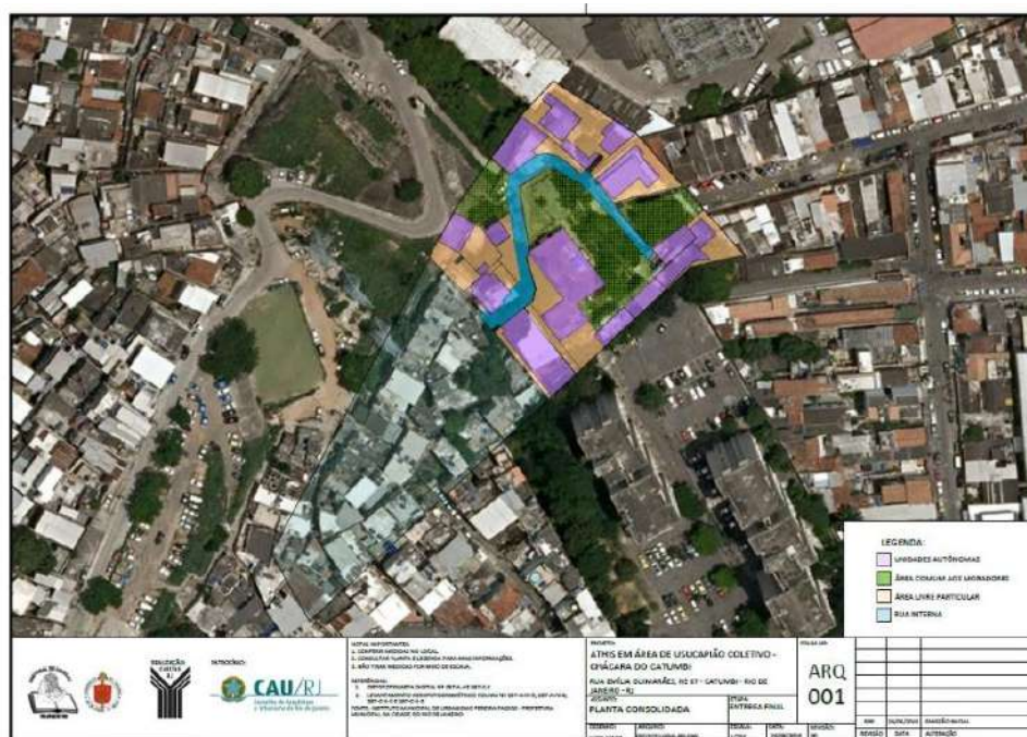
Figure 4. Site de la Chácara do Catumbi. La partie du site en noir et blanc a été occupée après la chute du mur.

mais en vain. Finalement, l'héritière s'est définitivement désintéressée du site de la Chácara.