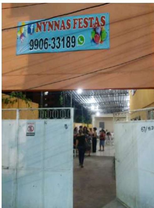
Figure 8. Salle de fêtes où les réunions du projet se sont réalisées

mission. Cependant, malgré les nombreux conflits liés au partage des coûts d'entretien du site, tous ont exprimé leur appui à l'établissement d'une contribution mensuelle.